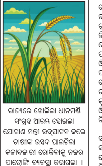
ରାଜ୍ୟରେ ଖୋଲିଲା ଧାନମଣ୍ଡି