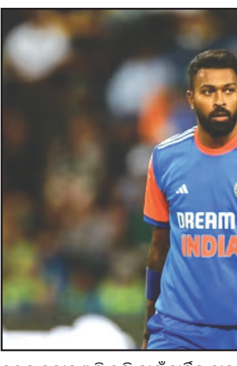
ସୟଦ ମୁଷ୍ଟାକ ଅଲ୍ଲୀ ଟ୍ରଫି ପାଇଁ ହାର୍ଡିକ ତାଙ୍କ ଯତ୍ନେ ଦଳ ବରୋଦାକୁ ଫେରୁଛନ୍ତି।

ହାର୍ଡିକ ପାଣ୍ଡାଙ୍କୁ କଠିନ ସ୍ଵାସ୍ଥ୍ୟରେ ଭିତର ପରେ ଯତ୍ନେ ଖେଳିବାକୁ କମ୍ପ୍ୟାକ୍ କରୁଛନ୍ତି। ନଭେମ୍ବର ୨୩ରୁ ସୟଦ ମୁଷ୍ଟାକ ଅଲ୍ଲୀ ଟ୍ରଫି ପାଇଁ ହାର୍ଡିକ ତାଙ୍କ ଯତ୍ନେ ଦଳ ବରୋଦାକୁ ଫେରୁଛନ୍ତି।