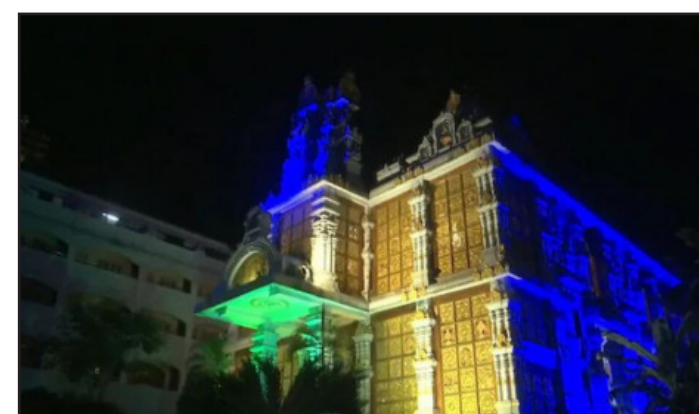
ଦେବାକୁ ଧମକ ଦେଇଥିଲେ । ତୁରନ୍ତ ଏନେଇ ସେମାନେ ପୁଲିସକୁ ଖବର ଦେଇଥିଲେ । ଖବର ପାଇ ପୁଲିସ ବୋମା ନିଷ୍ପିନ୍ଧ ଷ୍ଟାର୍ ଏବଂ ତରୁ ଷ୍ଟାର୍

ତିରୁପତି ନେଇ ଘଟଣାସ୍ଥଳରେ ପହଞ୍ଚିଥିଲା । ମନ୍ଦିରରେ ବ୍ୟାପକ ସର୍ତ୍ତ ଅପରେସନ୍ କରାଯାଇଥିଲା । କିନ୍ତୁ ମନ୍ଦିରକୁ ସେପରି କୌଣସି ବିଷୋଇକ ସାମଗ୍ରୀ କିମ୍ବା ଅନ୍ୟ ଆପତ୍ତିକରକ ଜିନିଷ ମିଳି ନାହିଁ । କେହି ଜାଣିଶୁଣି ଏପରି ଆତଙ୍କ ପୁଷ୍ଟି କରୁଥିବା ସନ୍ଦେହ କରାଯାଉଛି । ଏହାପୂର୍ବରୁ ଅକ୍ଟୋବର ୨୬ରେ ମଧ୍ୟ ତିରୁପତିରୁ ଦୁଇଟି ପ୍ରତିଷ୍ଠିତ ହୋଇଥିଲେ ବୋମା ଧମକ ମିଳିଥିଲା । ତଦନ୍ତ ପରେ କୌଣସି ସାମଗ୍ରୀ ମିଳିନଥିଲା । କେହି ମିଛ ରିପୋର୍ଟ ଦେଇ ଆତଙ୍କ ପୁଷ୍ଟି କରୁଥିବା ସନ୍ଦେହ କରାଯାଉଛି । ଭାରତୀୟ ସିପାନ ଏବଂ ହୋଟେଲଗୁଡ଼ିକୁ ମଧ୍ୟ ଲଗାତାର ଭାବେ ଏପରି ଆତଙ୍କ ପୁଷ୍ଟିକାରୀ କଲ୍ ଓ ମେସେଜ୍ ମିଳୁଛି ।