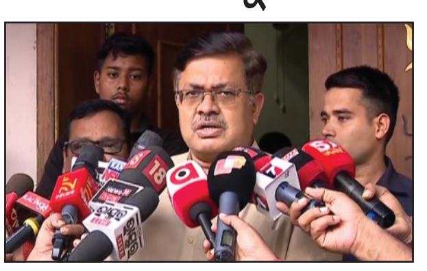
ଗୁରୁତ୍ୱ ଦିଆଯିବ। ୩୦-ମନିରଗୁଡ଼ିକ ଯେଉଁକି ଆର୍ଥିକ କ୍ଷେତ୍ରରେ ଅଧିକ ସମ୍ପାନ୍ ଦିଆଯାଇପାରିବ ସେନେଇ ଚର୍ଚ୍ଚା-ଆଲୋଚନା କାରି ରହିଛି। ସରକାର ଏବେ କୁ-ପ୍ରିଣ୍ଟ ପ୍ରସ୍ତୁତ କରୁଛନ୍ତି।

ପରିଚାଳନା ସମସ୍ୟାର ସମାଧାନ ପାଇଁ ରାଜ୍ୟ ସରକାର ଏକ ନୂଆ ଯୋଜନା ଆଣିବାକୁ ଯାଉଛନ୍ତି। ମନିର ଓ ୩୦ର ପରିଚାଳନା ଦୃଷ୍ଟିକୋଣରୁ ଯେଉଁସବୁ ସମସ୍ୟା ଓ ସହାୟତା କଥା ଆପଣଙ୍କ ସେବିଗରେ ଗଭୀର ଭାବେ ଚିନ୍ତା କରାଯାଇଛି। ଯେଉଁସବୁ ଦିଗ ଦୀର୍ଘଦିନ ଧରି ଅବହେଳିତ ହୋଇ ରହିଛି ତାକୁ