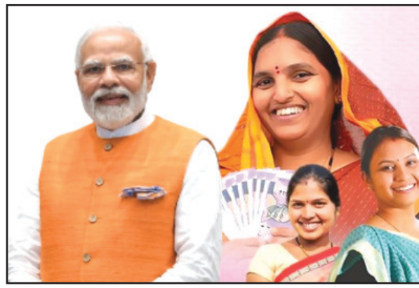
ସେପଟେ ସୁଭଦ୍ରା ଯୋଜନାର ବ୍ୟାପକତାର ପ୍ରସାର ପାଇଁ ବଡ଼ ପଦକ୍ଷେପ ନେଇଛନ୍ତି ସରକାର । ସବୁ ବିଭାଗ କରିବେ ସୁଭଦ୍ରା ଯୋଜନାର ବ୍ୟାପକତାର ପ୍ରସାର ପାଇଁ ବଡ଼ ପଦକ୍ଷେପ ନେଇଛନ୍ତି ସରକାର । ସବୁ ବିଭାଗ କରିବେ ସୁଭଦ୍ରା ଯୋଜନାର ବ୍ୟାପକତାର ପ୍ରସାର ପାଇଁ ବଡ଼ ପଦକ୍ଷେପ ନେଇଛନ୍ତି ସରକାର ।

ପ୍ରତି ଫାଉଣ୍ଡରେ ଜିପିଏଲଏପିଏ ନେତୃତ୍ୱରେ ହେବ । ଏସବୁ ମା ମାନେ ମଧ୍ୟ ଗାଁ ଗାଁରେ ସାମିଲ ହେବେ । ଭୁବନେଶ୍ୱରରେ ଗିରିଦୁର୍ଗା ମନ୍ଦିରରୁ ରମାଦେବୀ ଯାଏଁ ସୁଭଦ୍ରା ପଦଯାତ୍ରା ହେବ ବୋଲି ସେ କହିଛନ୍ତି । ସୁଭଦ୍ରା ସହାୟତା ଉପଲବ୍ଧି ହେବ ଆହୁରି ସହଜ । ତାଙ୍କ ବିଭାଗ ବ୍ୟାଙ୍କ ଆକାଉଣ୍ଟରେ ବି ମିଳିବ ସୁଭଦ୍ରା ପ୍ରୋତ୍ସାହନ ରାଶି । ଓଡ଼ିଶା ତାଙ୍କ ପରିମଣକ, ଇଣ୍ଡିଆ ପୋଷ୍ଟ ଫେଡ଼େରାସ୍ୟନ୍ କରାଯାଇଛି । ଏହି ସେବାକୁ କରିଥାଉ ଏହି ସେବାକୁ ଯୋଗାଇବ । ସମସ୍ତ ୮୯୧୨ ତାଙ୍କ ଘର ଆକ୍ସେସ୍ ପ୍ୟଟ୍‌ରୋବରେ କାର୍ଯ୍ୟ କରିବ ଏବଂ ୯୫୦୦ ତାଙ୍କ କର୍ମଚାରୀ ଏହି କାର୍ଯ୍ୟରେ ନିଯୋଜିତ ହେବେ । ଇଣ୍ଡିଆ ପୋଷ୍ଟ ଫେଡ଼େରାସ୍ୟନ୍ ବିଷ୍ଟ ପରିସୀମା ମାଧ୍ୟମରେ ପ୍ରତ୍ୟେକ ଯୋଗ୍ୟ ମହିଳା ନିର୍ଦ୍ଦେଶାବଳୀ ତଥା ସହଜ ବ୍ୟାଙ୍କିଂ ସେବା ପାଇପାରିବେ ।